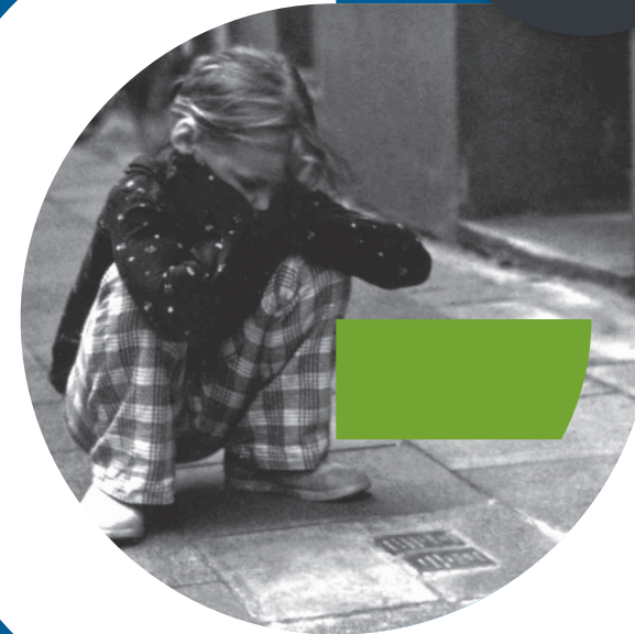
vor meiner Haustür »Stolpersteine von Gunter Demnig«

»Man fällt nicht über die Stolpersteine. Du stolperst mit dem Kopf und mit dem Herzen.«